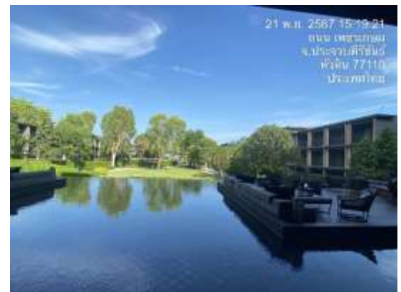
ภาพที่ 1.2-2 – สภาพโครงการปัจจุบัน